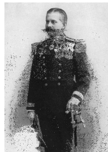
ハインリッヒ肖像写真