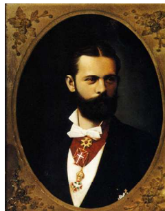
アレクサンダー肖像