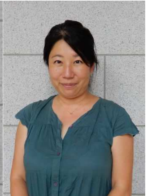
「築地居留地の料理人」