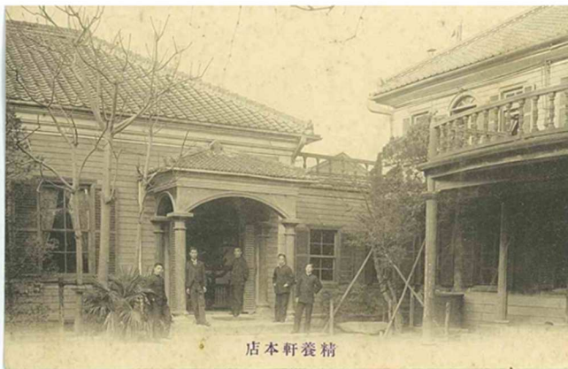
絵葉書 築地精養軒 (～M40)

今回は我が国を代表する本格的な西洋料理店として、 1872(明治5)年に創業、150年を超える精養軒の歴史について 発刊された『精養軒150年史』を基にその精神や伝統の味を守 ってきた経緯を講演していただきます。